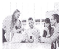
La Red Premium Ligatus