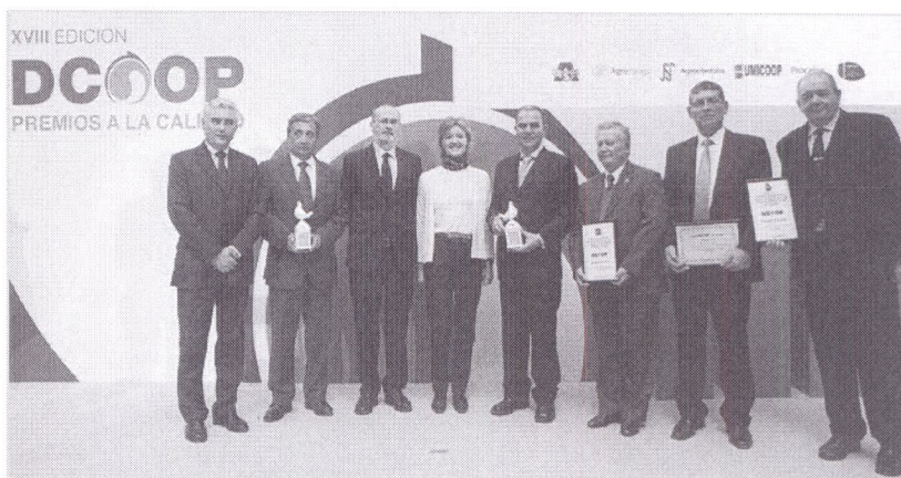
Foto de familia con los galardonados, ayer en Madrid. En el centro, la ministra de Agricultura, Isabel García Tejerina.

Tejerina, que entregó los décimo octavos Premios a la Calidad del Aceite de Oliva organizados por el grupo alimentario, mencionó los cambios "de calado" en las normas nacionales, encaminados a potenciar la fusión del sector agroalimentario, entre los que ha destacado aquellos destinados a favorecer la integración.