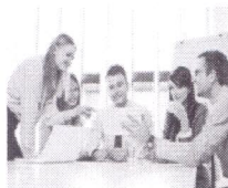
La Red Premium Ligatus