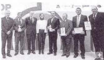
La ministra Isabel García Tejerina, junto con los galardonados.

La campaña de la aceituna 2013-2014 dejará en la provincia de Córdoba dos millones de jornales menos que la actual, según advirtió ayer el delegado de Agricultura, Pesca y Medio Ambiente, Francisco Zurera, de acuerdo a las previsiones de producción, un 60% inferiores al año pasado. Zurera pidió al Gobierno central que establezca medidas que contribuyan a paliar la pérdida de empleo y consideró que el Ejecutivo central "debe de eximir del requisito de las 35 peonadas para acceder al subsidio agrario" y ha de impulsar un plan especial de fomento del empleo agrario "que contribuya a reducir el efecto de esta bajada de cosecha y por tanto, de empleo". Zurera confió en que se abra una negociación con los sindicatos y los productores para llegar a las 20 peonadas para garantizar el subsidio, pues "en los pueblos ya se está sufriendo porque no hay cosecha".