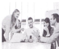
La Red Premium Ligatus